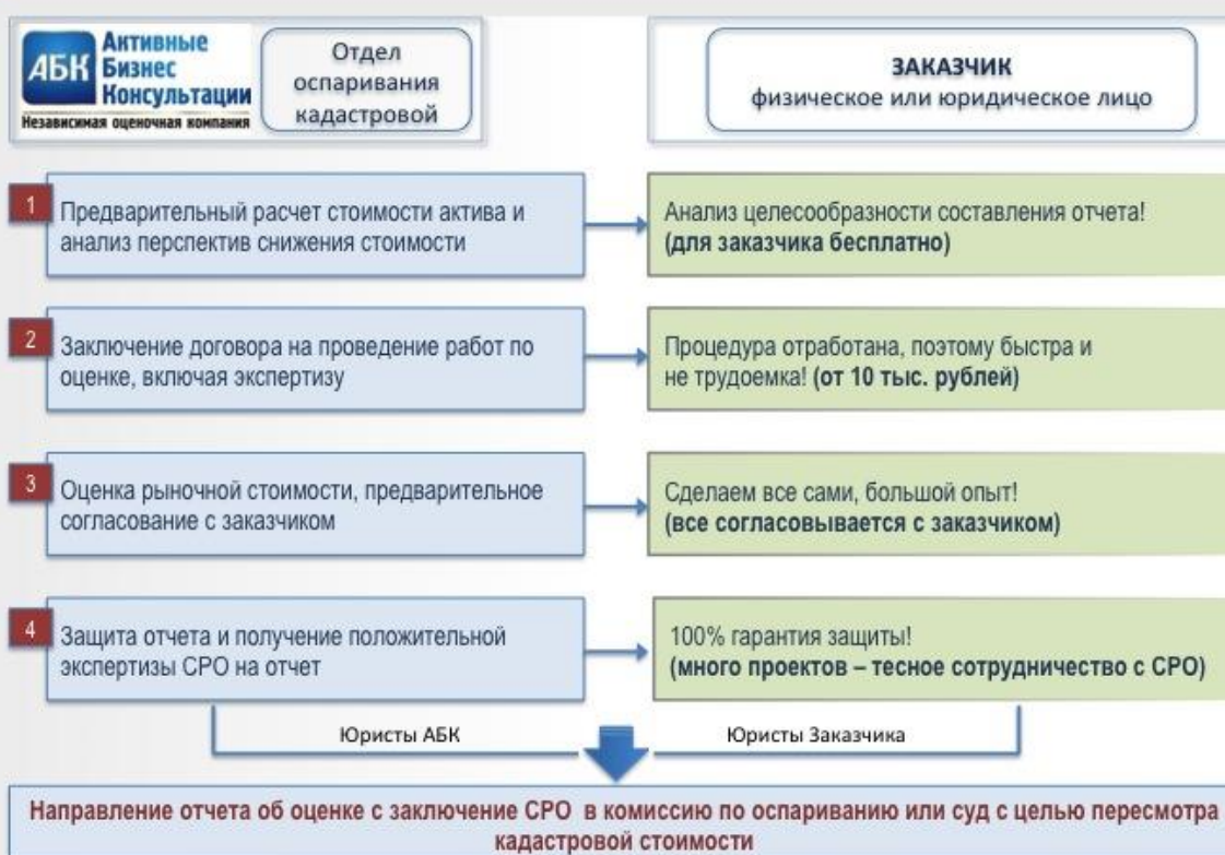
СХЕМА ОСПАРИВАНИЯ КАДАСТРОВОЙ СТОИМОСТИ В АБК